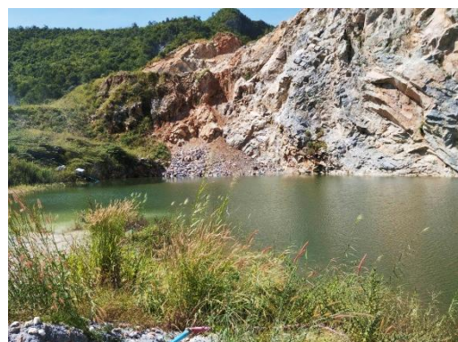
ลักษณะภูมิประเทศพื้นที่โครงการ